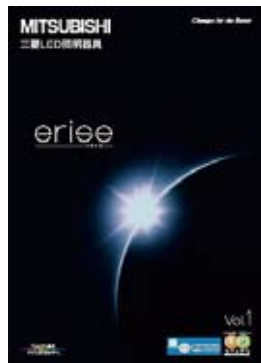
[ 新カタログ ]