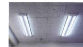
天井所内照明(専用器具使用)