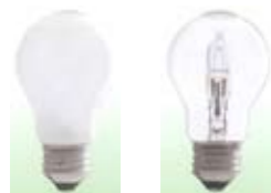
ホワイトタイプとクリアタイプの2種類

実は3年程前から発売されていましたが、いまひとつ認知度が低い状況でした。白熱電球が、製造中止や品薄状態が続いている今だからこそ！とご紹介させていただきます。電球型蛍光灯では明るくなるのに時間がかかるし、LEDに置換えするには価格がちょっと……。ましてやクリア球にかわる物がない！！などという方には是非お奨めの商品です。